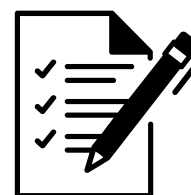
PV de l'AG du club validant d'être absorbé

Une fois la demande réalisée, le club absorbé reçoit une demande d'accord de "Fusion-Adoption" dans Footclubs