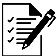
PV de l'AG du club absorbant