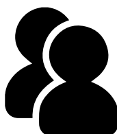
Les statuts du club absorbant